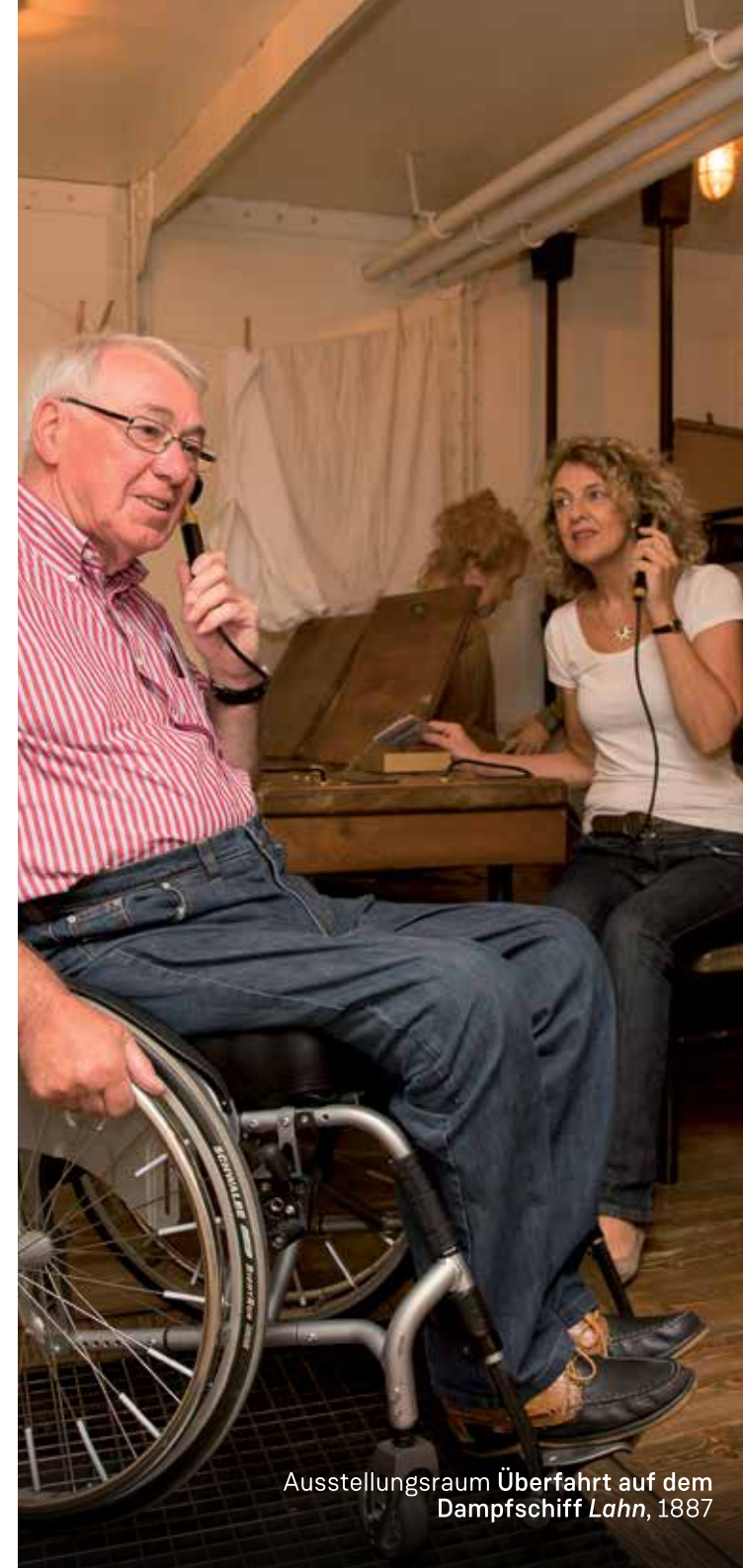
Ausstellungsraum Überfahrt auf dem Dampfschiff Lahn, 1887

ausgewählte Biographien als Ausdruck an der Kasse. Es werden Führungen in Gebärdensprache angeboten. Eine Anmeldung ist erforderlich.