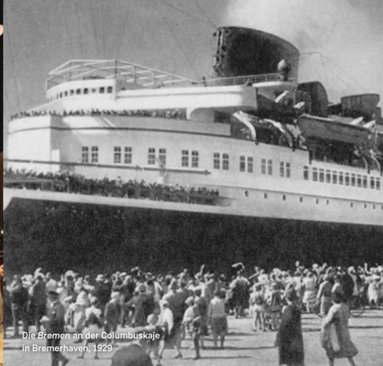
Die Bremen an der Columbuskaje in Bremerhaven, 1929