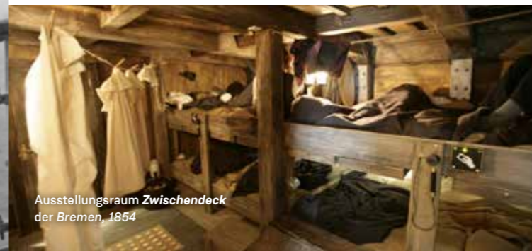
Ausstellungsraum Zwischendeck der Bremen, 1854

Sechs Wochen im dunklen Zwischendeck eines Segelschiffes mit 400 Fremden – oder sechs Tage auf dem Ocean Liner mit Tanzlokal und üppigem Buffet? Lernen Sie in detailgetreuen Rekonstruktionen die Überfahrt auf Segel- und Dampfschiffen aus Sicht der Passagiere kennen und gehen Sie danach an Land: Dürfen Sie einreisen? Der Test in der Einwanderungsstation Ellis Island vor den Toren New Yorks wird es zeigen. Im Grand Central Terminal finden Sie anschließend heraus, was aus den deutschen Einwanderern in Übersee wurde.