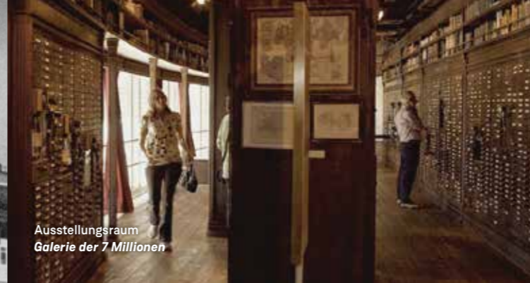
Ausstellungsraum Galerie der 7 Millionen