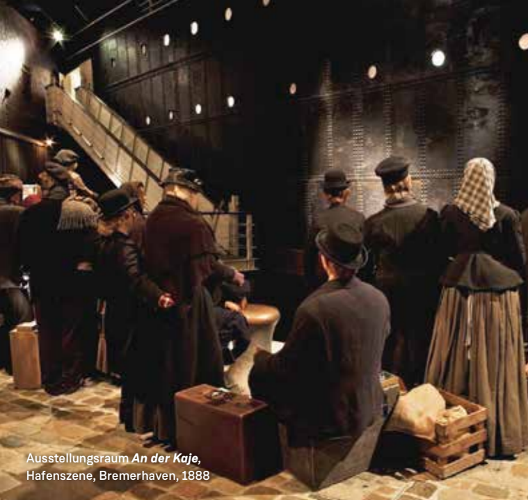
Ausstellungsraum An der Kaje , Hafenszene, Bremerhaven, 1888