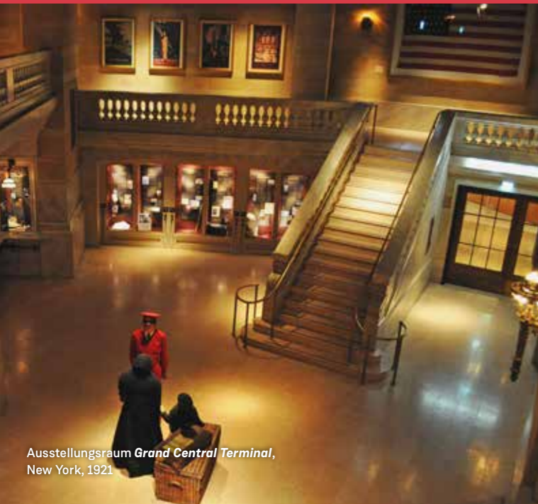
Ausstellungsraum Grand Central Terminal , New York, 1921